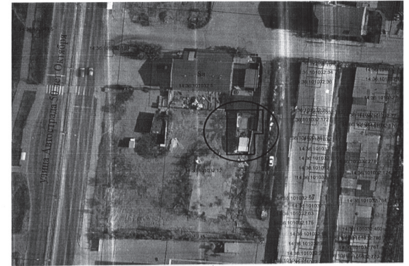
Схема расположения объекта самовольной постройки № 1